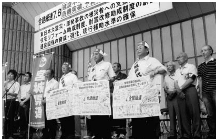
寄せ書きを手にする宮城・福島・岩手の会長