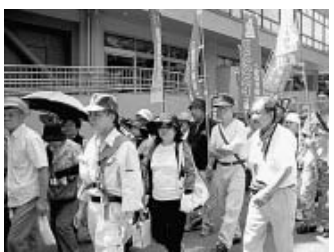
生活と暮らしを守ろう!

会各政党会派に交渉団を注ぎ、建設国保組合を育成・強化すること。都発注工事の低入札競争による賃金単価の下落を政策的に改善し、公契約条例の早期制定を求める。東