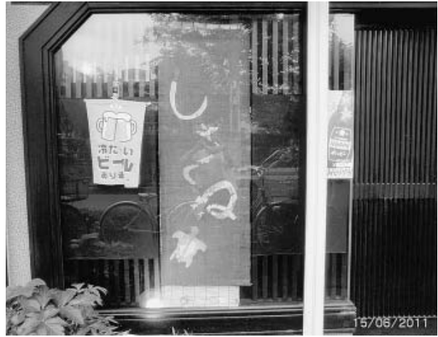
戸の奥には、楽しい時間が

【京葉一・工藤芳朗記】アスベストの多くは、建材に使用されている関係から、その被害者は建設業に従事している仲間が多い。 肺がん、中皮腫、石綿肺などのアスベスト被害者、亡くなった方の遺族が平成20年5月・6月に東京地裁と横浜地裁に提訴しました。いわゆる「首都圏アスベスト訴訟」です。その判決も来春判決がほぼ確定しましたので、「6・23首都圏アスベスト訴訟提訴3周年集会」が6月23日午後1時から日比谷公会堂で開催されました。 今までは建設従事者であるなら、誰でもアスベスト被害者になる危険