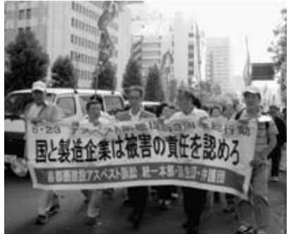
闘っている仲間のために